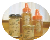
はちみつもよろしく!