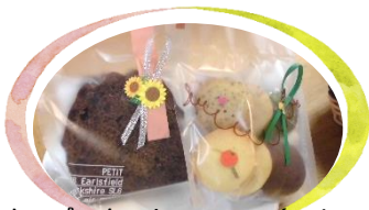
ホープのクッキー・スライスケーキ

今後も楽しく美味しく作りますので、ぜひホープのクッキー・ケーキをお手に取っていただくと嬉しいです。