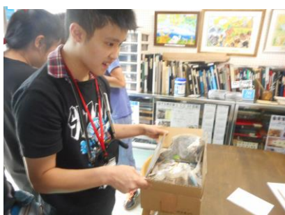
⑤ 切手は都内の業者へ 納品します