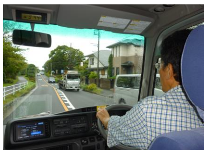
④ マイクロバスで 納品へ出発！