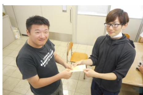
⑥ 売り上げは工賃として利用 者の方にお渡しします

藤の実学園は、切手作業で使用する切手(はがき・封筒)を集めております。 不要な切手がありましたら、ご一報いただければ幸いです。下記の住所に 送付していただいても構いません。少しでも多くの切手を頂き、利用者の方の 作業として使用させていただければと思います。