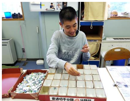
② 切手を種類別に分けます