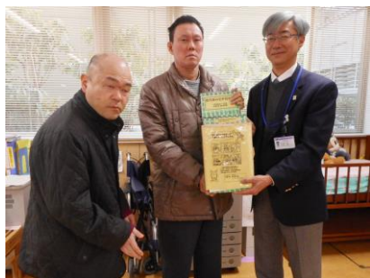
① 藤沢市内の市民センター等 へ切手を回収しに行きます