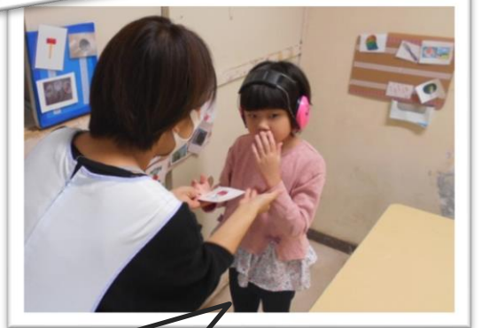
カードで好きな絵本を伝えてくれています