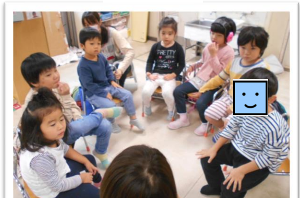
相手のことを見てくれるようになってきました

クラスでは、【集会の時間】と【コミュニケーションのスキルを高めること】を年度始めから特に大切にしてきました。集会では、風船を膨らませて飛ばす様子に注目するなど、楽しい出し物をする事で、見る力・聞く力・集中する力・着席する力を育てていくことを目的としています。また、コミュニケーションの力を養う為、コミュニケーションボードを活用して好きな本や玩具・行きたい場所など要求を伝えることも練習していて、だんだんと要求の表出ができるようになってきました。