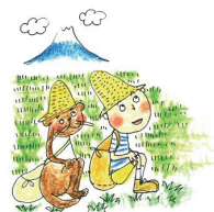
湘南ふくし村（本部）（藤沢市瀬郷）