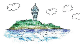
藤沢南地域福祉部（藤沢市鵠沼海岸）