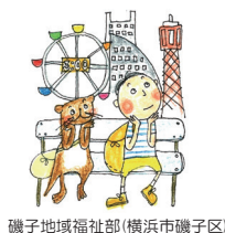
磯子地域福祉部（横浜市磯子区）