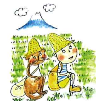
湘南ふくし村(本部) (藤沢市榑郷)