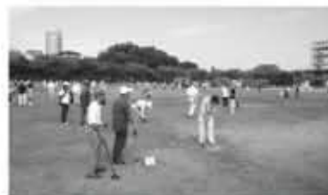
ふれあいグラウンドゴルフ大会

◆お問い合わせは、六会市民センター 地域担当まで TEL:0466-81-6677