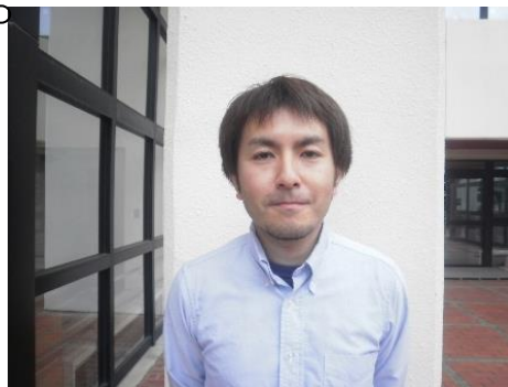
藤の実学園サービス管理責任者