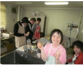
みんなで一緒に 野菜を刻みます。