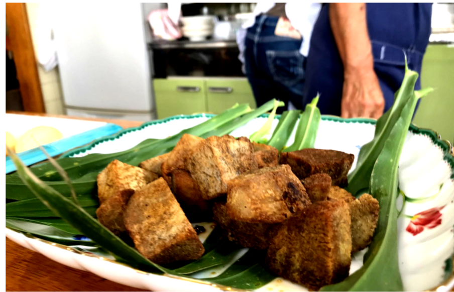
『サ-タン-アンダ-ギー(パンタイツ)』 よくねった、イ-スト入りの小麦粉を、ヒ-ンホ-ン玉ほどに丸くまるめて、やや低温の油で揚げました。