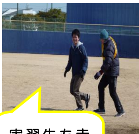
実習生も走 りました!