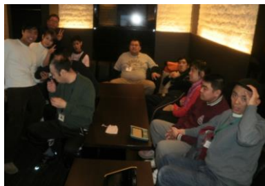
ごはん後にはカラオケを しました☆