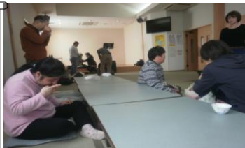
温泉入った後まったり 過ごしました(^)/