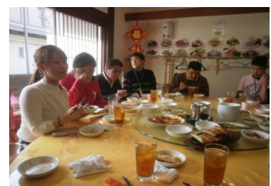
中華料理もとても美味し かったです