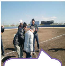
生活班は3班 で1チーム☆ 全員力走!