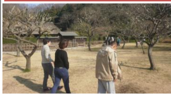
公園散策もしました☆