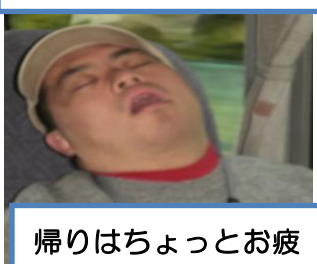
帰りはちょっとお疲 れで寝ちゃいました …ZZZ