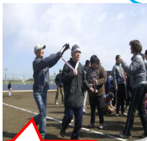
襷を次に繋 ぎます!