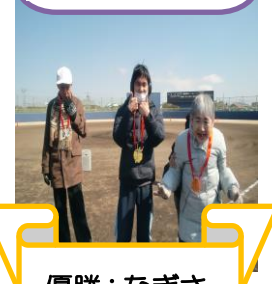
優勝:なぎさ 準優勝:つき 3位:生活